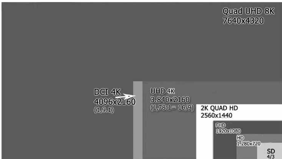
Figura 2. Comparación entre distintos formatos y resoluciones (Elaboración JMC).

Resumiendo: EL formato 4K es y se conoce como DCI 4K, tiene una resolución de 4096x2160 y una relación de aspecto de 1,9:1.