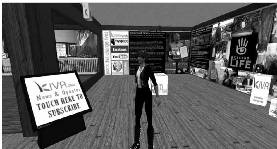
Figura 5. Recursos de información en la sede de una ONG en SL.

Es usual que cuando un avatar entra en la sede virtual de la organización reciba automáticamente un mensaje de bienvenida escrito en el chat. También se suele recibir una notecard y un landmark . Lo primero es una nota escrita que se puede guardar en el propio inventario del usuario y que da información esencial sobre la organización, su misión, sus objetivos, dirección, etc. El landmark o hito es un archivo SL que también se almacena en el inventario del avatar y que contiene la dirección, el SLURL del lugar, de manera que el avatar pueda volver fácilmente o pasarlo a otros. Además, en todas las entidades visitadas se ha encontrado una pantalla con enlace a la web de la entidad, a la que se puede acceder desde la propia pantalla dispuesta en el espacio de SL, sin necesidad de abrir un navegador externo que saque al usuario del entorno inmersivo.