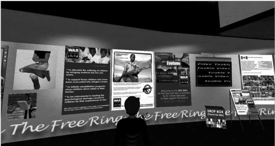
Figura 6. The Free Ring, tienda de War Child en SL.

Por su parte War Child, también con sede en NPC, tiene además una tienda, The Free Ring (Figura 6), en otra comunidad de carácter social y lúdico. Como atracción para el avatar, la tienda dispone de un stand de donación. Cuando un avatar deposita dinero, se le obsequia con una foto con una pose artística y un fondo encantador.