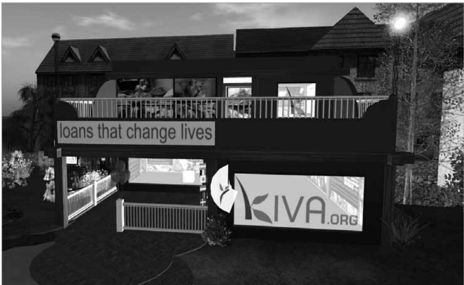
Figura 4. Kiva.org en AloftCommons en SL.

NPC cuenta, además, con espacios comunes para todas las organizaciones que la integran, entre ellas está un anfiteatro de uso general situado en el centro de una región, destinado a reuniones de las organizaciones para poner en común problemas y estrategias, para organizar jornadas, seminarios y congresos y otros eventos. Además, cuenta con jardines, un puerto y plazas públicas donde sentarse a charlar o como espacio para desarrollar eventos dentro de un marco más informal.