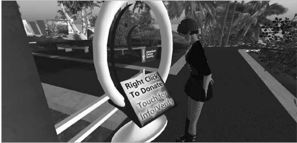
Figura 2. Caja de donación en la sede de la ACS en SL.

organizaciones. El espacio de la organización no es en propiedad sino que se renta al dueño de la región que puede ser una asociación de organizaciones o una empresa soporte.