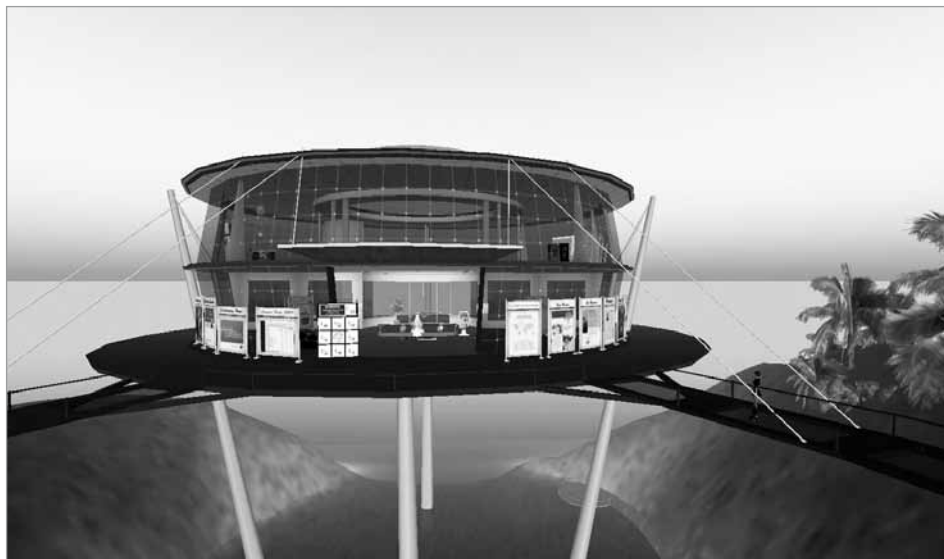
Figura 1. Sede de la ACS en SL.

virtual un aspecto muy especial. Llegado el avatar a un inmenso edificio circular, Anatomica, puede vestirse con un traje protector, montar en un submarino y emprender un viaje por la sangre humana donde verá cómo se forman y actúan las células cancerígenas, y podrá luchar contra ellas siguiendo las indicaciones que se le van proporcionando.