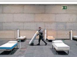
El hospital de los Pabellones 7 y 8, en Cas Liso. Españoles del Gobierno regional y extranjeros de la Unidad Militar de Emergencias (UME) trabajan aquí el hospital que se instaló en febrero, con capacidad de 1500 camas y 100 unidades de cuidados intensivos, en una foto facilitada por su Comandante.