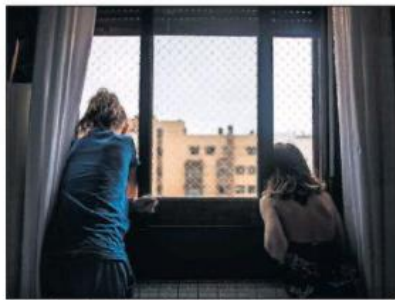
Un niño espera por la verificación de su caso durante el confinamiento por el coronavirus.