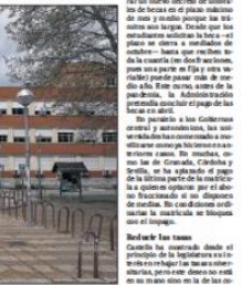
Escuela de la Facultad de Derecho de la Universidad Complutense de Madrid, el 2 de abril.

El Gobierno de la Región de Murcia ha anunciado que va a permitir a los alumnos que no tienen derecho a beca de emergencia que puedan pagar sus tasas y matrícula.