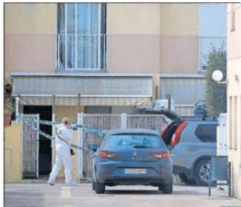
Guardias civiles, ayer en el lugar del primer asesinato machista de Alameda (Madrid).

No había presentado denuncia previa. El agresor, de 35 años, en compañía de su hijo y su hijo menor, se acercó a la puerta de la vivienda de la víctima, en un momento en el que ella estaba ingresada en estado grave después de que su pareja machista le hubiera dado un golpe en la cabeza con un objeto contundente. El agresor se acercó a la puerta de la vivienda y le dio un golpe en la cabeza con un objeto contundente. El agresor se acercó a la puerta de la vivienda y le dio un golpe en la cabeza con un objeto contundente.