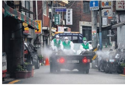
CORÉA DEL SUR SE MOVILIZA CONTRA EL RESORTE. El país que se pone de ejemplo en la gestión de la pandemia combate un rebrote con alrededor de un centenar de contagios relacionados con la reapertura de bares y clubes. En la imagen, labores de desinfección en las calles de Seúl.

HUGO GUTIÉRREZ Madrid El gestor de los aeropuertos españoles, Aena, prepara un protocolo de seguridad para evitar la propagación del virus en las terminales, uno de los puntos mayores de riesgo por el elevado tránsito de personas. La empresa pretende impedir el acceso de los acompañantes de los viajeros a la terminal, según el boletín al que ha accedido este diario. También plantea reducir los asientos en las zonas de espera para embarcar. Págs 36 y 37