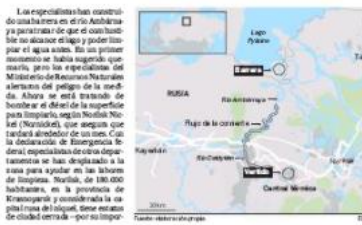
La explotación ha controlado una hectárea en el río Andarax y para tratar de que el combustible se acumule en el lago y poder limpiar el agua salada. En un primer momento se había sugerido que...