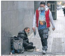
Una protesta multitudinaria por el derecho a la vivienda, en Madrid, el 14 de mayo de 2020.

servicio de comedor gratuito por su falta de recursos económicos. Es llamativo cómo cambió la perspectiva informativa, teniendo en cuenta el gran número de niños y niñas afectadas por esta situación.