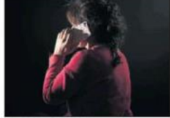
Una víctima de violencia machista por su móvil.

El acuerdo de que la Cumbre del Clima se pospone a 2021 fue anunciado ayer por el primer ministro británico Boris Johnson y todos los Gobiernos que participan en la cumbre. El acuerdo de que la Cumbre del Clima se pospone a 2021 fue anunciado ayer por el primer ministro británico Boris Johnson y todos los Gobiernos que participan en la cumbre.