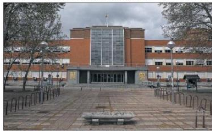
Escuela de la Facultad de Derecho de la Universidad Complutense de Madrid, el 2 de abril.

subsidio a otros alumnos y en los planes de diez semanas cubren el coste de la beca. En el País Vasco, Castilla y León, gobernadas por el PP y Ciudadanos, ya han mostrado su intención de contribuir los recursos de las becas para becas de emergencia.