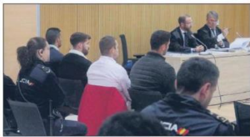
Los cuatro imputados de La Manada, durante el juicio por los abusos de Pozoblanco.

posterior explicación, se muestran las medidas de la ley: “ampliación de la prescripción”, “evitar la victimización secundaria” 119 , “juzgados especializados” 120 , “retirada de la patria potestad” 121 , “agentes de autoridad” 122 , “educación” 123 , “protocolos” 124 , “delitos a través de Internet” 125 , “deber de denunciar” 126 , “indicadores de riesgo” 127 , “registro de víctimas” 128 y “tercer grado y permisos” 129 .