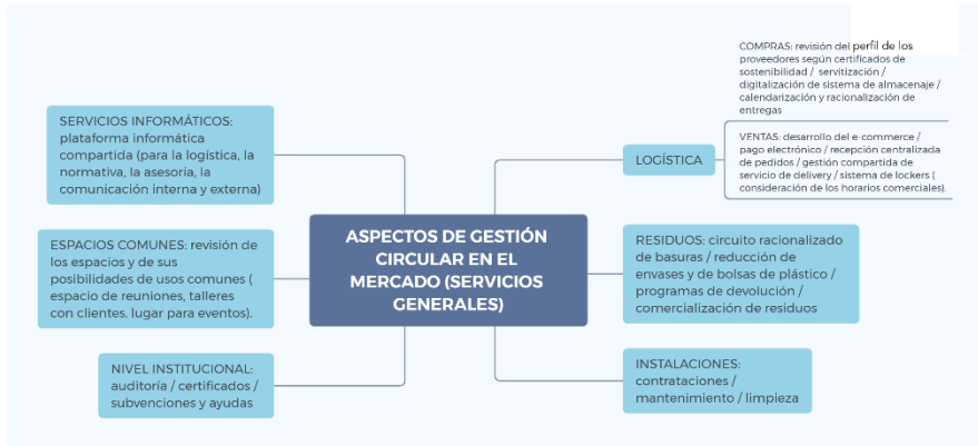
FIGURA 3. Aspectos de gestión circular en el mercado (Servicios generales).