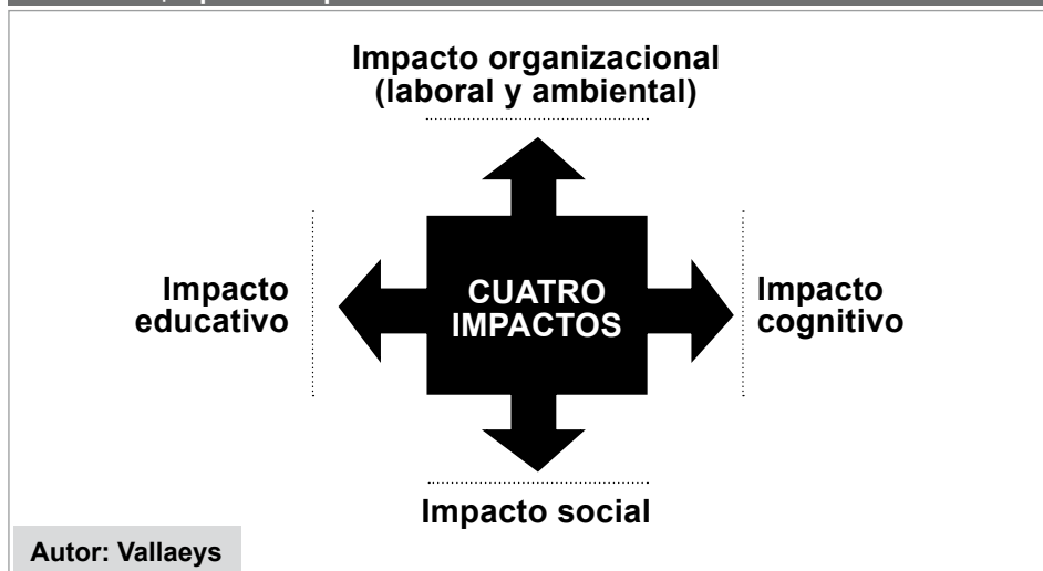
* TABLA I | Tipos de Impactos universitarios