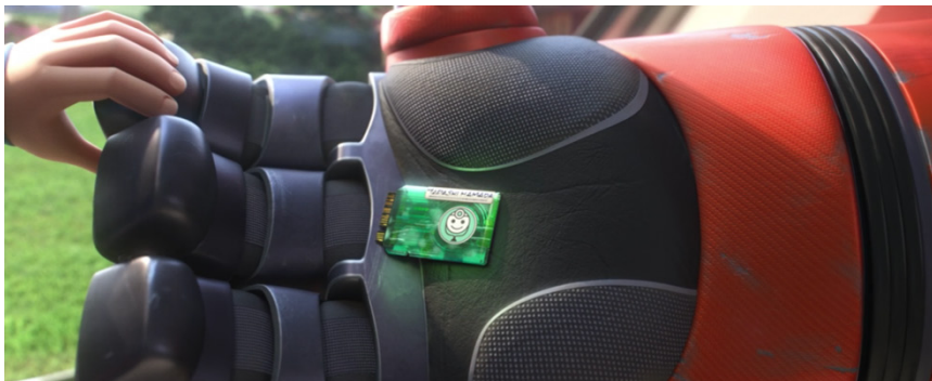
Figura 5. Puño de la armadura de Baymax

Fuente: Big Hero 6 (Hall & Williams, 2014)