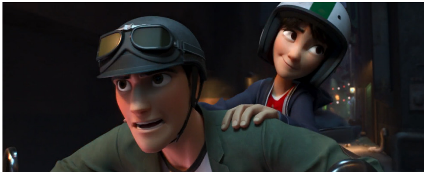
Figura 1. Tadashi y Hiro huyen de los participantes en las peleas de robots