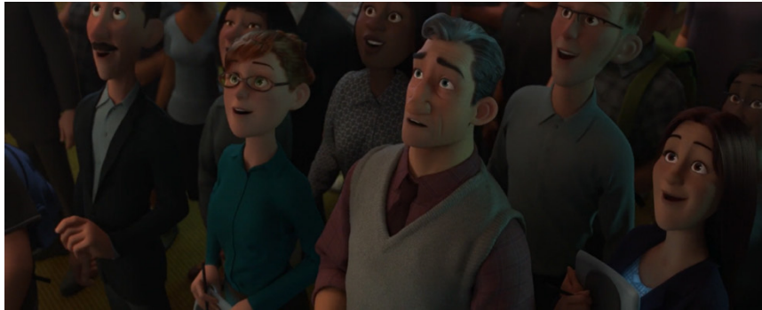
Figura 7. Callaghan admira los microbots de Hiro