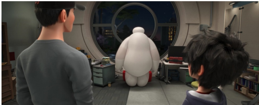
Figura 8. Tadashi muestra a Hiro su nuevo invento: Baymax

Fuente: Big Hero 6 (Hall & Williams, 2014)