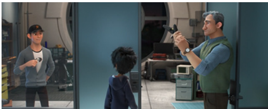
Figura 6. Callaghan examina el robot de Hiro