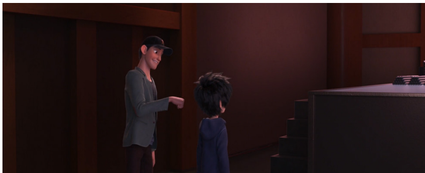
Figura 3. Tadashi y Hiro hacen su saludo especial