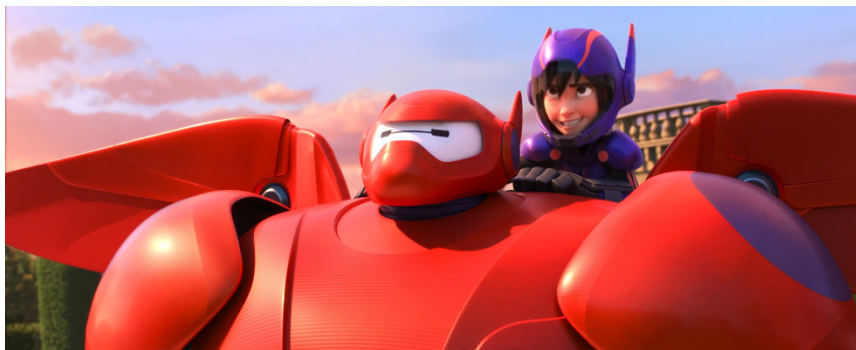
Figura 2. Baymax y Hiro se preparan para hacer una prueba de vuelo

Fuente: Big Hero 6 (Hall & Williams, 2014)