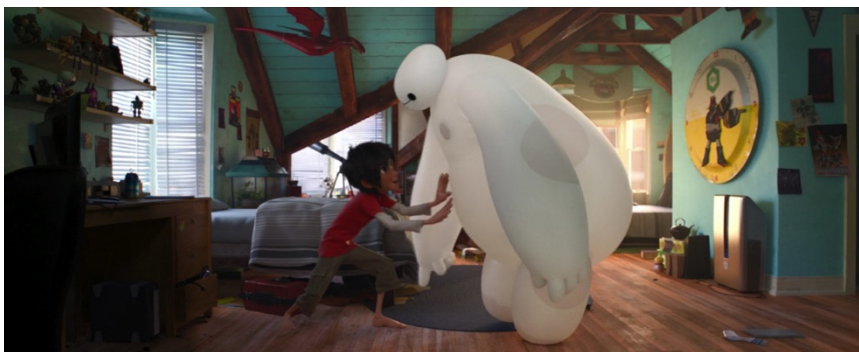
Figura 9. Baymax se activa en respuesta al dolor de Hiro e intenta ayudarlo